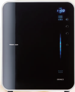
連続生成型電解水素水整水器