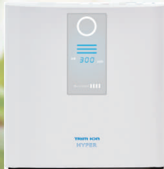
連続生成型電解水素水整水器